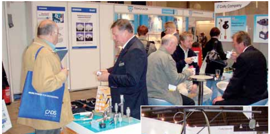
Yllä kuvassa esittelyssä VEH-pikaliittimet ja oikealla GAV-niittausautomaatti.

Kunnossapidon ja teollisten palvelujen päätapahtuma on suunnattu kunnossapidon, tuotannon ja suunnittelun ammattilaisille. Teolliset Palvelut 09-messut jatkaa