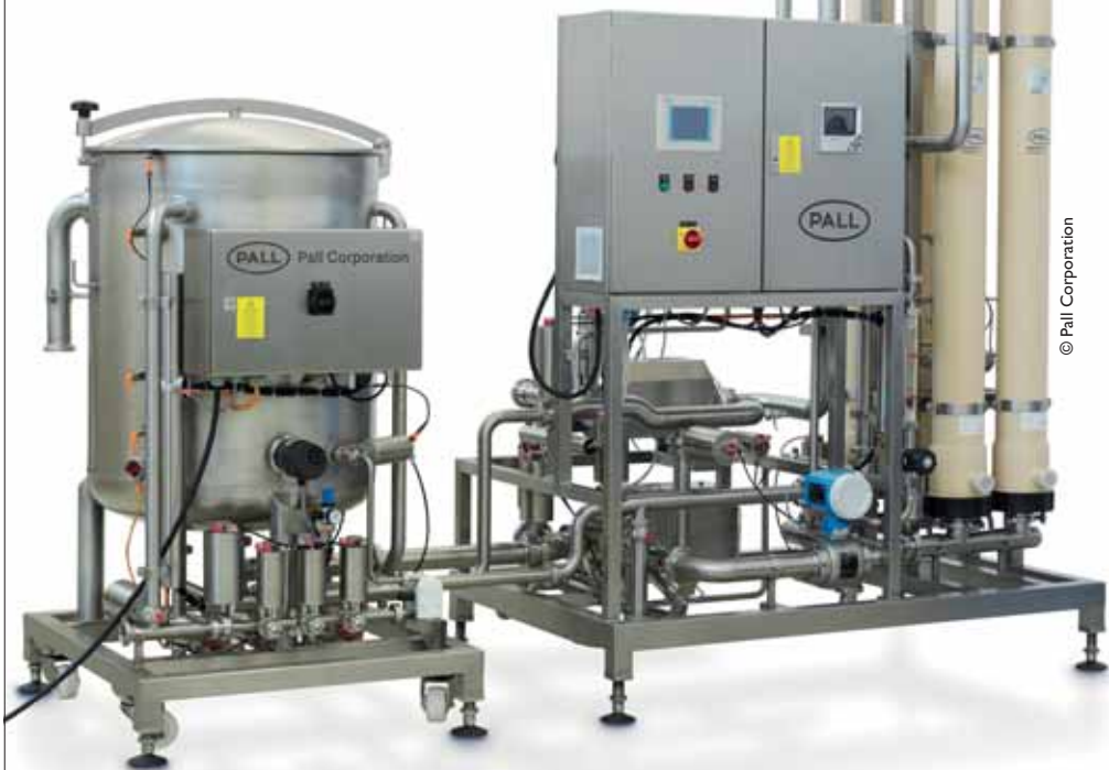
Pall Aria FB4 -järjestelmä 20 m 3 /h vedenkäsittely.

lita käsittelemällä talteenotettu vastavirtapesu ennen kuin se palautetaan suodattimeen. Teollisuudessa on järjestelmiä, joissa käsittelyä tarvitaan satojen kuutioiden vastavirtapesuvirtaamille päivässä. Veden kierrätys on avain vesimaksujen pienentämiseksi laitoksella sekä vesijalanjäljen pienentämiseksi. Kemiaallinen käsittely voi nopeuttaa jäteveden virtaaman selkeyttämisäikää, mutta se lisää kierrätyskäsittelyn kustannuksia. Lopuksi, vedenkäsittelylaitokselta ulostuleva jätevirta voi sisältää erityyppisiä epäpuhtauksia, kuten selkeyttimen lietettä, jossa on