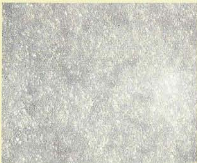
Öljynäyte: Pall Ultipor III, \beta_3 \geq 200

Suuri kapasiteetti edellyttää tehokkaita suodattimia, 3 \mu\text{m} , \beta_3 \geq 200