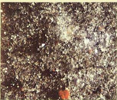
Öljynäyte: Suodattimena 10 \mu\text{m} nimellisuodatin