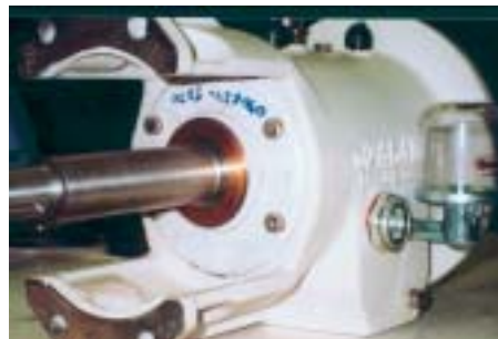
Pumpun laakerointi Inpro-tiivisteellä.